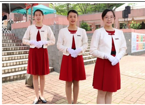
說明：111 學年度就業博覽會迎賓