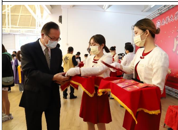
說明：111 學年度成年禮