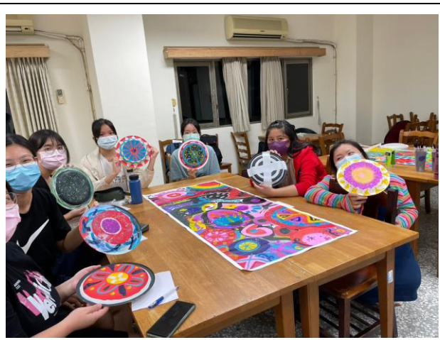
學生的圓圈繪畫/小組創作和個人創作 1