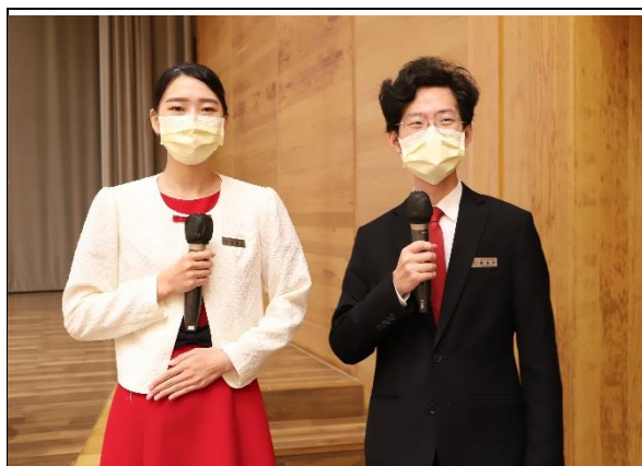
說明：111 學年度第一學期南華共識營