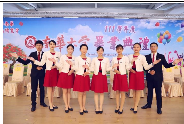
說明：111 學年度畢業典禮