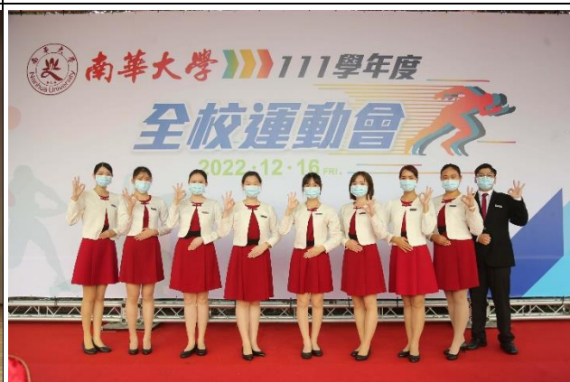
說明：111 學年度全校運動會