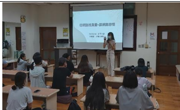
5/24 講師說明網路戀情的危機與陷阱