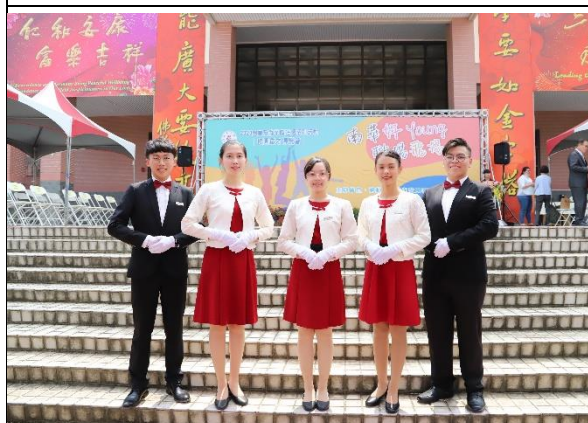
說明：111 學年度校園徵才博覽會