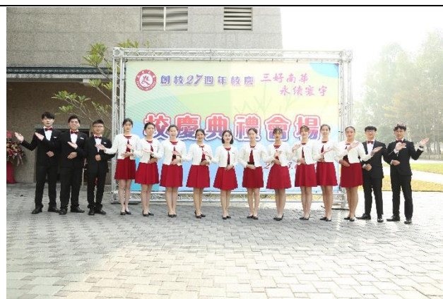
說明：111 學年度南華大學創校 27 週年校慶