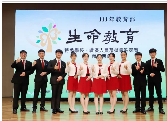
說明：111 年教育部生命教育特色學校、績優人員及微電影競賽頒獎典禮