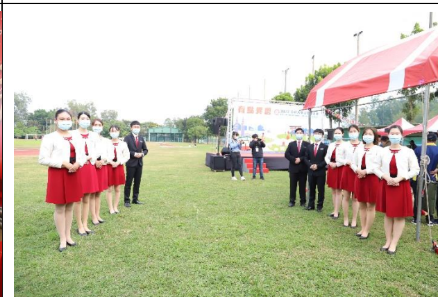
說明：2022 國際藝文節開幕式