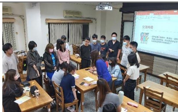
4/12 講師以愛情卡帶領成員自我探索