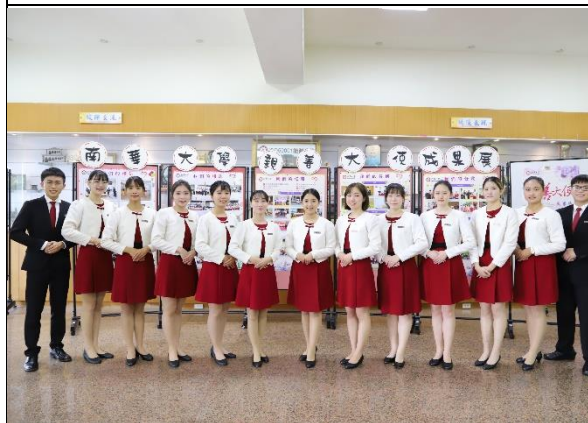
說明：111 學年度親善成果展