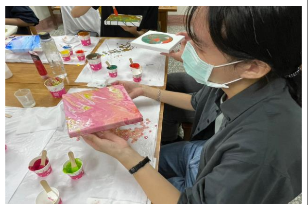
參與者創作出接近自我的作品