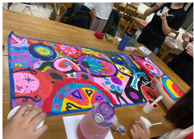
學生小組一起共創作品 3