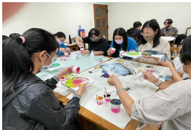
學生認真進行個人流體畫的作品創作