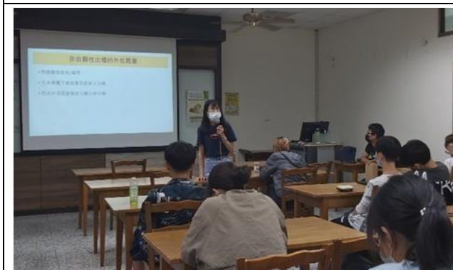
5/4 講師進行電影評析談同志出櫃主題