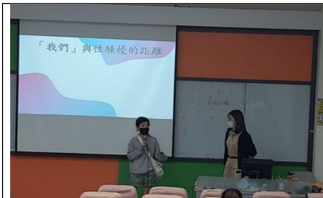
3/15 講師邀請同學分享遭遇騷擾的經驗

(四)112年5月24日(週三)18:00-21:00,於C322辦理主題為《從網路找真愛-談網路戀情》的講座,講師呂鳳鑾心理師運用影片與愛情卡協助同學認識網戀的特性與危機,計有36人參加,成員回饋良好,認為講師對於網戀危機說明詳盡,讓同學可以避免掉入網愛陷阱而受傷。