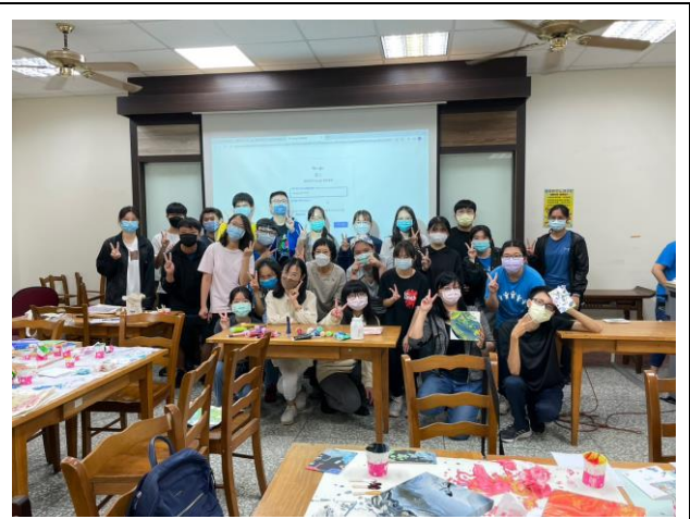
流體畫活動-大合照