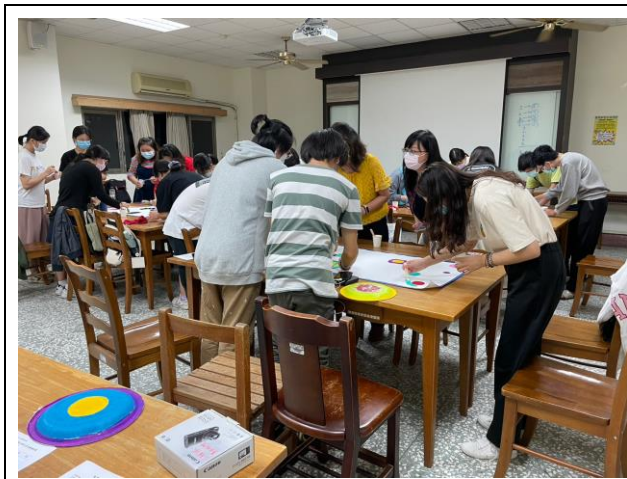
大家一起共創小組創作

參與者也在回饋中分享這段創作過程的體悟，「看見彼此身上的美，也體驗到很多人們心中的美」，「也更能包容自己各種樣貌」，透過參與者創作和經驗回饋，感受到此活動給參與者帶來的積極影響。