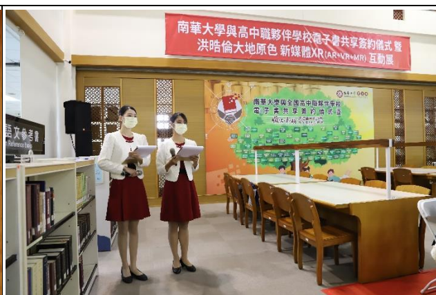
說明：南華大學與高中職夥伴學校電子書共享簽約暨新媒體互動體驗展