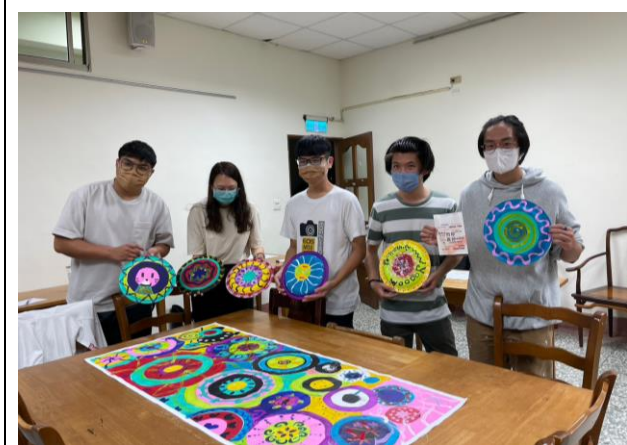
學生的圓圈繪畫/小組創作和個人創作 2