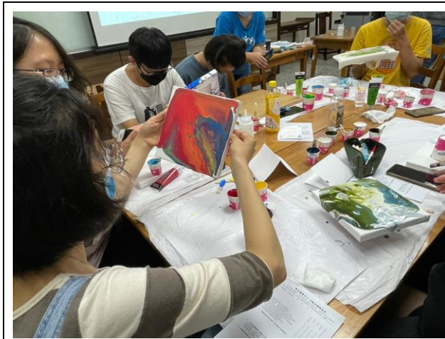
流體畫的個人創作