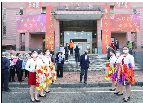
說明：111 學年度迎接棒球隊-迎賓